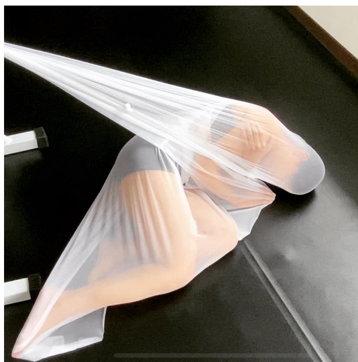
圖說：表演者與水體裝置發展的過程側拍。